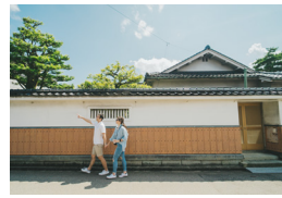
長町武家屋敷跡界限