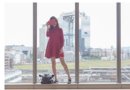
HERBIS PLAZA ENT