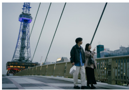
久屋大通公園(元TV塔)